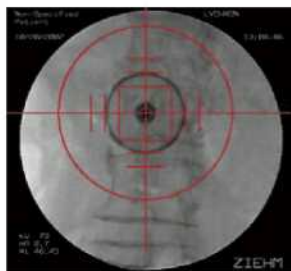
Система визуализации “Бычий глаз”